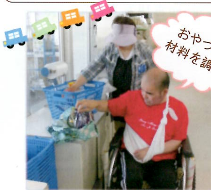
スーパーにお買い物へ

「さくさく工房 絆」では、4月から提供時間を延長し、より充実した活動ができるようになりました。「お出かけ」「お菓子作り」「季節の行事」と皆さん、思い思いに楽しまれています。