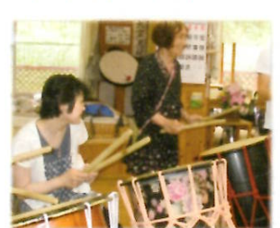
和太鼓の演奏に挑戦