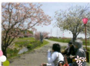
桜を見ながらいっぱく