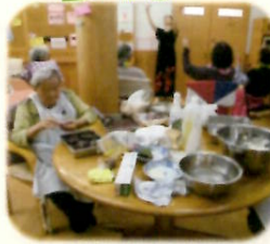
毎年恒例の柏餅作り