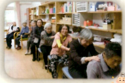
～体力づくり～ 足腰丈夫に ふまねつと