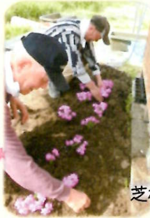
朝の生け花タイム 芝桜を植えました