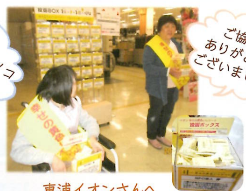
東浦イオンさんへ イエローレシートキャンペーン