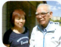
松谷さんと一緒に