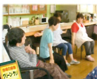
グリーン・ラソへ