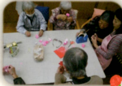
～手作業～ 母の日のカーネーション作り