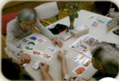
～頭の体操～ カードで絵合わせ

「デイサービスセンター絆」では、毎月週替わりで「体力測定」「手作業」「体力作り」「頭の体操」といったテーマを設けており、皆さん、いろいろなメニューに挑戦されています。