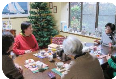
コミットの会の様子

ご近所に独居の方が増える中、お互いを知り、何でも話せる場の大切さを思い、交流の場として立ち上げたそうです。