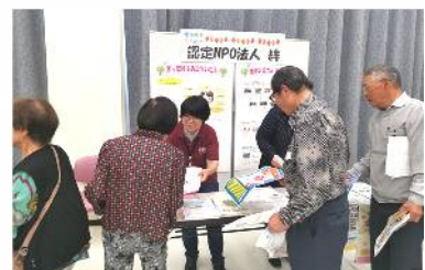
絆の助け合いや居場所を説明するブース