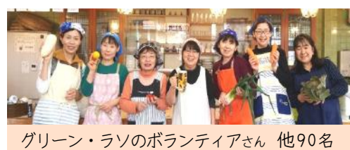
グリーン・ラソのボランティアさん 他90名