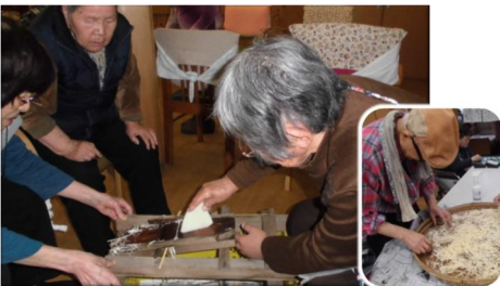
切り干し大根名人のNさん は大根も道具も持参で…