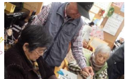
陶芸先生のHさん 完成まで責任重大です♪