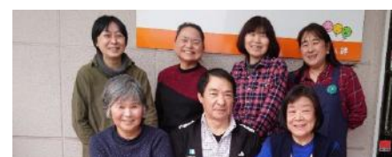
ラソ・プラザのボランティアさん 他30名