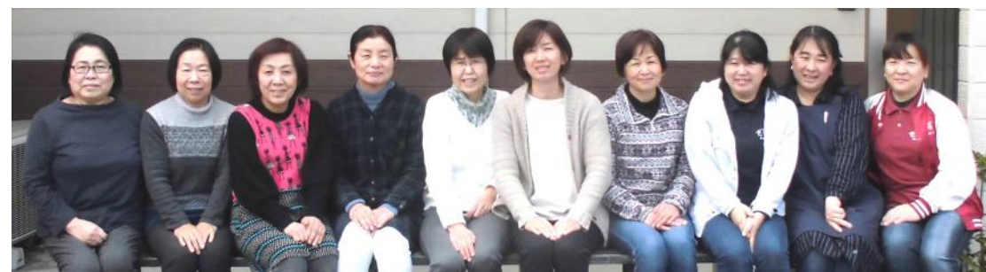
活動を調整する コーディネーター10名、ヘルパーさん70名