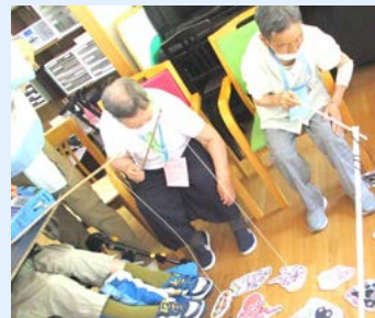
縁日気分を満喫した夏祭り