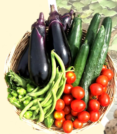
ラソファーム でとれた野菜