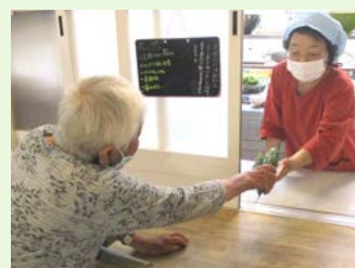
とれたて野菜はキッチンへ