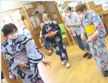
浴衣にマスクで盆踊り♪

2020年の夏。今年も猛暑になりました。デイの畑では、皆さんが丹精込めて育てた彩とりどりの野菜を、たくさん収穫できました。また、小規模ながら密を避け、夏祭りも開催。コロナ禍に負けず、楽しまれたデイの夏の様子をご紹介します。