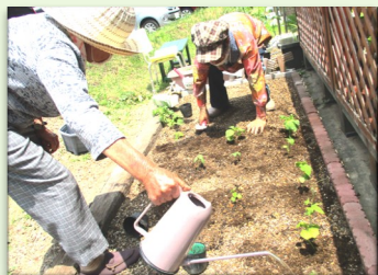
「畑の仲間ができて楽しい」