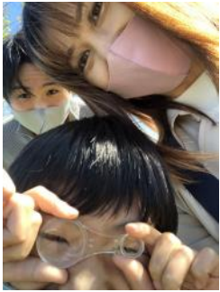
ご主人、息子さんとともに