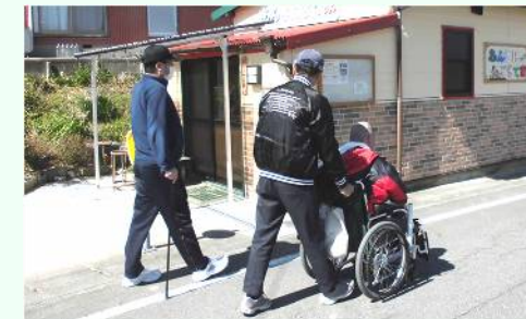
運動不足解消、ダイエット、リハビリり… それぞれの目標に向け、一步一步