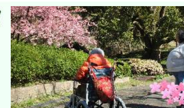
散歩の途中の楽しみは、おしゃべり、花見、池のカモ探しなどなど