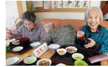
仲良しさん同士で♪