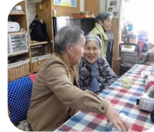
今日はどこに座ろうかね～

絆のデイサービスの昼食風景は「楽しく食べる」工夫でいっぱい。気の合う人と一緒に食べたい！好きな席に座りたい！そんな皆さんのこだわりや選択を大切にしています。ご飯やお茶をよそったり、下膳ももちろんご自分で。いつもと変わらぬ日々の暮らしをそのままに……。