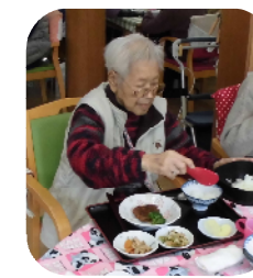
お隣の方にもそつと気配り