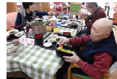
ご飯も自分でよそいます