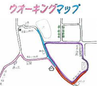
短いコースで気分転換、 長いコースでしっかり運動。