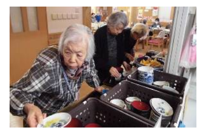
食器を分けて… 下膳中