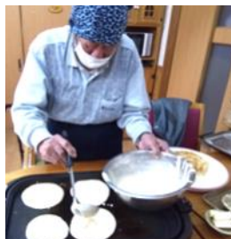
ホットケーキ作り

「作るの楽しかった。これも勉強の一つだね。」とおやつ作りの楽しさを発見！ この日はホットケーキに挑戦しました。エプロンと三角巾姿がとってもお似合い♪