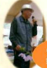
のど自慢大会 鐘は3つ～♪