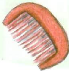
題字 折田ヨシエ (89歳)