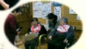
お地蔵さんにお悩み相談