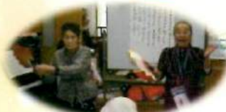
食べさせてるのは誰でしょう?