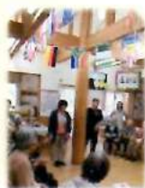
サイコロサッカー