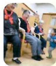
可愛い助っ人登場!