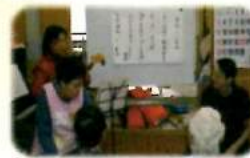
皆さんと一緒に演奏